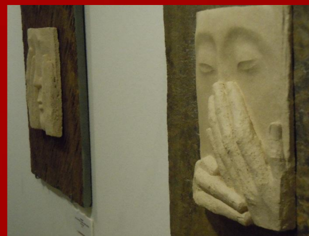
Sentimientos, El último encuentro 2012. Escultura en relieve.