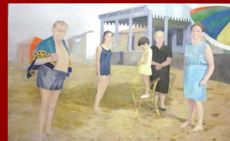
La playa, El último encuentro. 2012 óleo sobre lienzo.