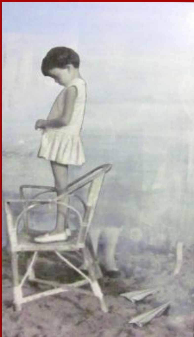
Aviones de papel. El último encuentro. 2012. Fotografía sobre lienzo y pintura acrílica.

“Que yo vibre mientras lo estoy haciendo creo que es la única manera de transmitirlo”