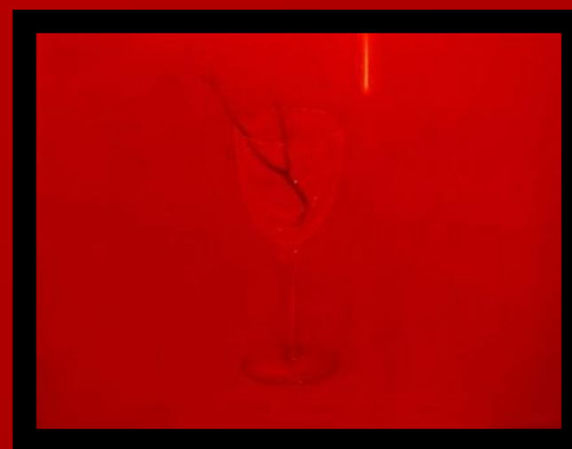
Copa, Paisajes involuntarios, 2010. acrílico sobre lienzo.